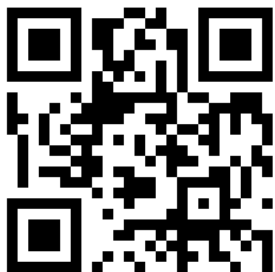
Figura 1. Código QR.

Un código QR puede lanzar las siguientes acciones con contenidos precisos (Bacchetta, 2017):